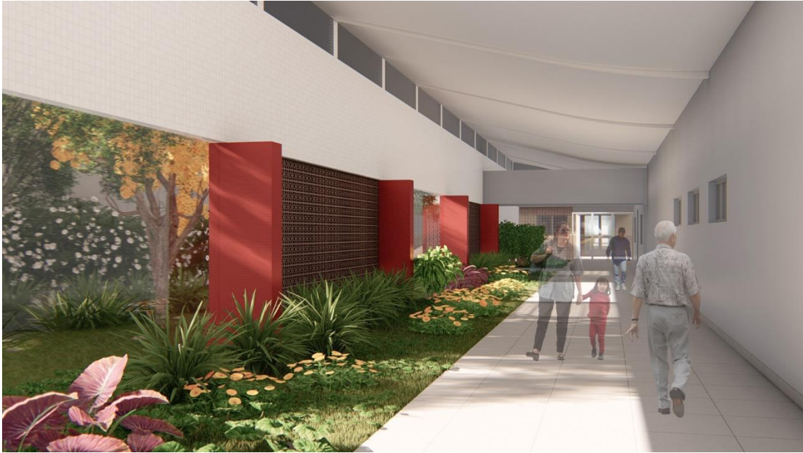
Fig.7 – Corredor principal