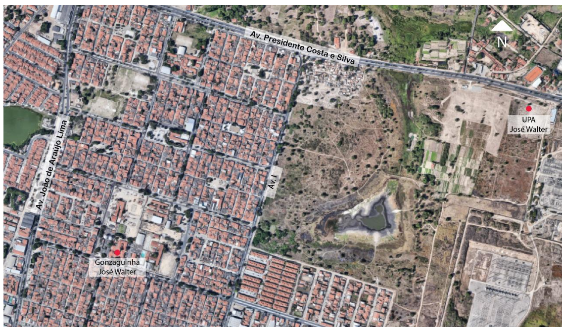
Fig.01 – Localização Gonzaguinha e UPA José Walter

Com a implantação da Unidade de Pronto Atendimento (UPA) do José Walter, o perfil assistencial do hospital, que anteriormente era obstétrico, clínico e pediátrico, sofreu alteração. A premissa de atendimento pediátrico e clínico passou para as UPAs, e ocorreu um aumento no número de atendimentos obstétricos no Gonzaguinha José Walter