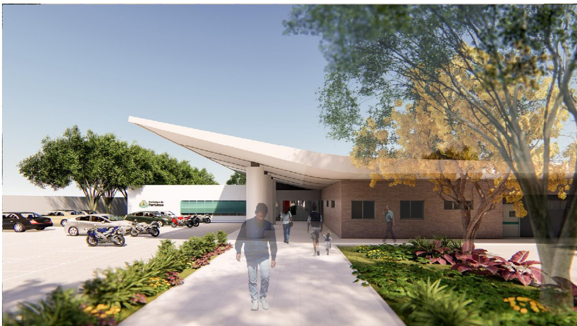
Fig.6 – Acesso principal