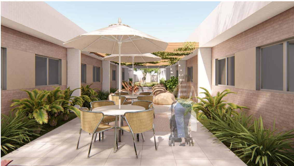
Fig.10 – Praça de deambulação