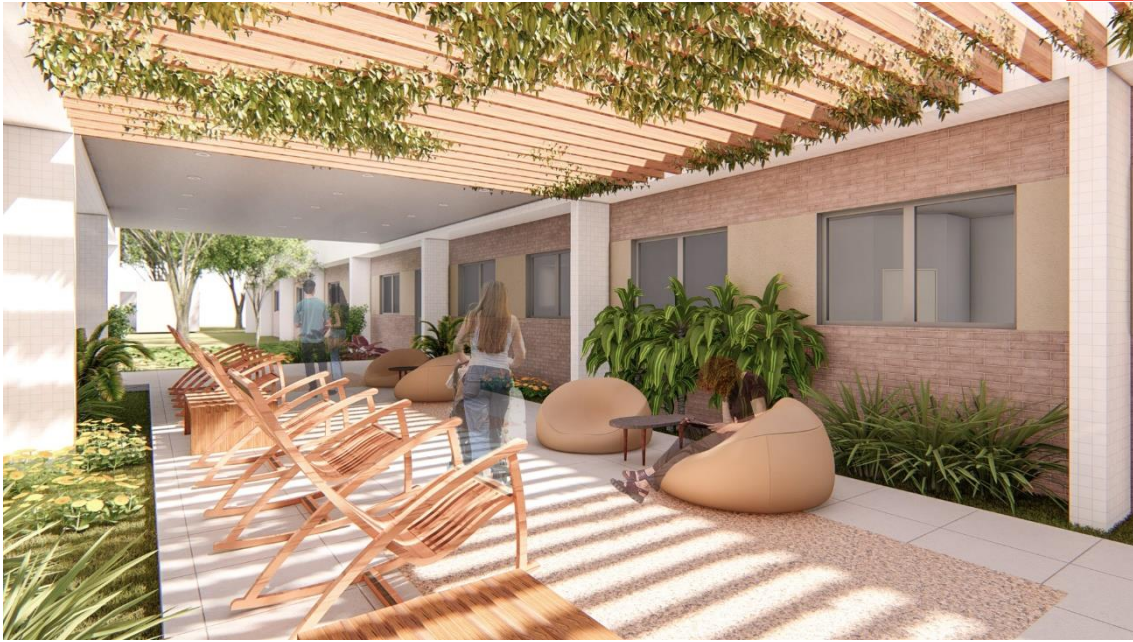
Fig.9 – Praça de deambulação