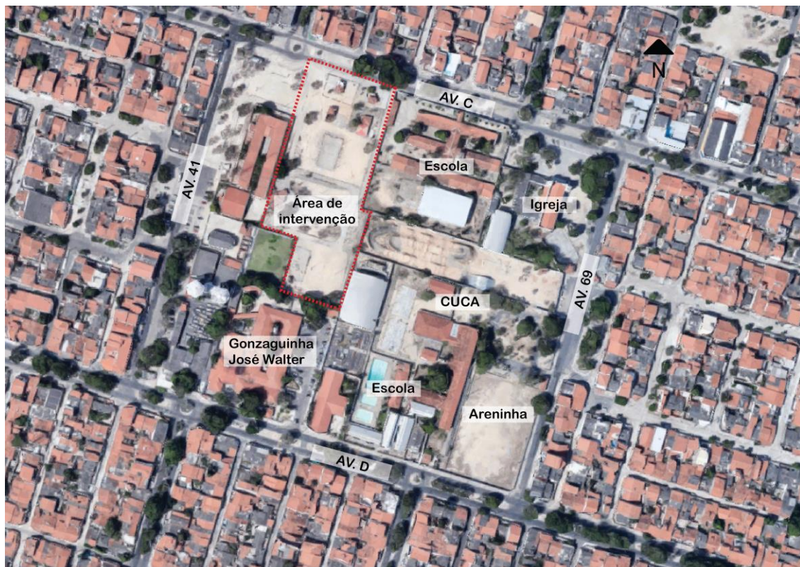
Fig.02 – Localização da área de intervenção para o novo hospital

O novo hospital foi proposto, seguindo a regulamentação da Agência Nacional de Vigilância Sanitária e VISA do estado do Ceará onde tem como orientação principal a RDC 50/2002, NBR 9050/2015 e demais normas referentes ao assunto.