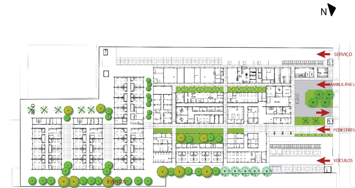
Fig.3 – Acessos do hospital

O acesso de pedestres, veículos e ambulâncias ao hospital será pela avenida C, contando com uma setorização de acessos, conforme unidade funcional. Assim, na fachada principal, voltada para a avenida, estão os acessos independentes à emergência, urgência obstétrica, urgência clínica, atendimento ambulatorial. Em uma das fachadas laterais está o acesso a toda a área de apoio técnico e logístico com pátio de descarga.