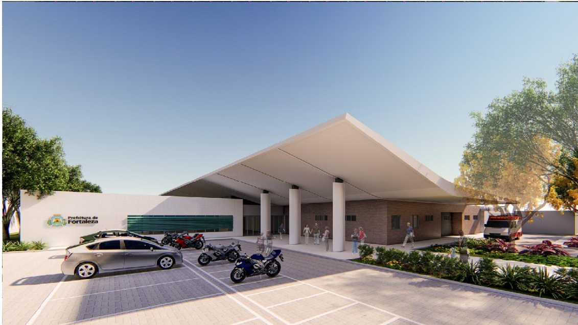
Fig.5 – Acesso principal