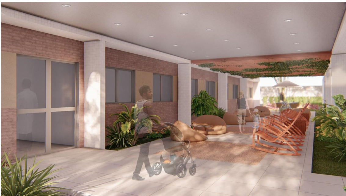
Fig.8 – Praça de deambulação