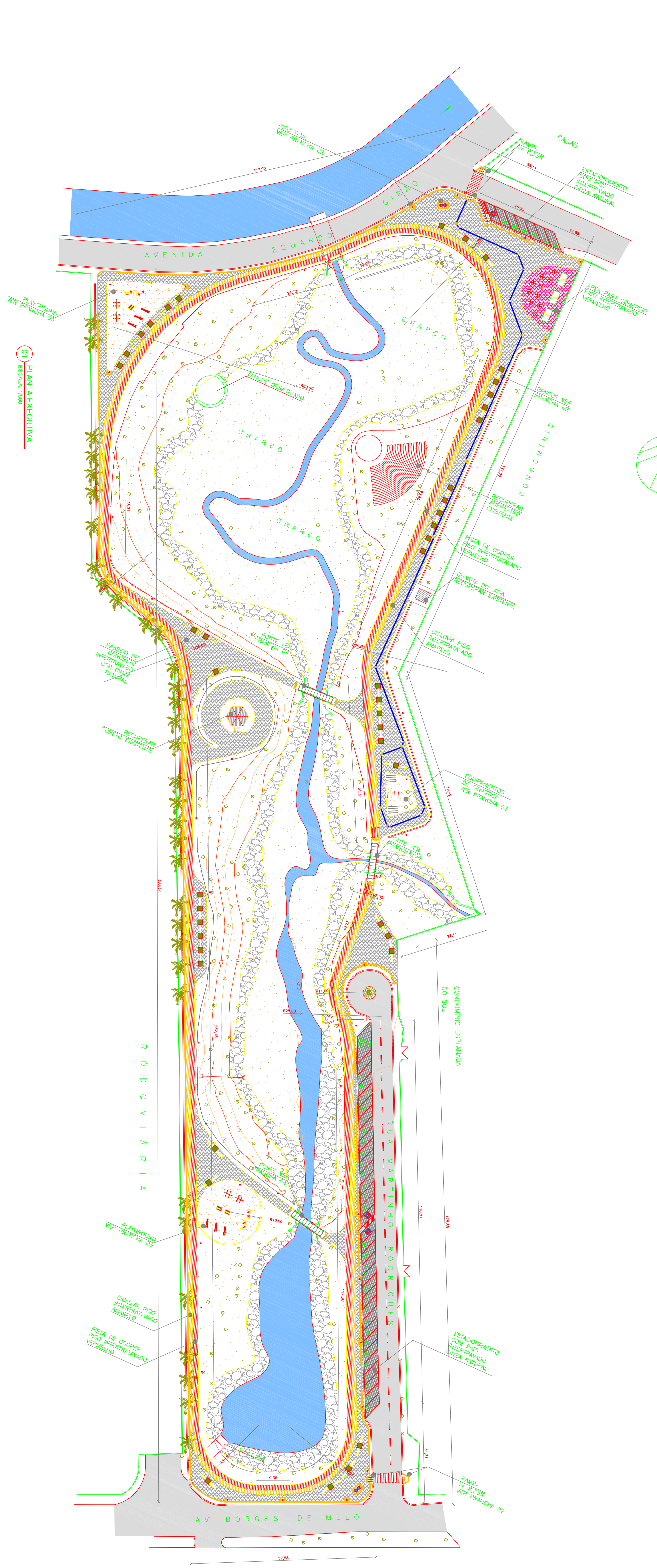
01 PLANTA EXECUTIVA ESCALA 1:500